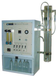
标准粒子发生装置