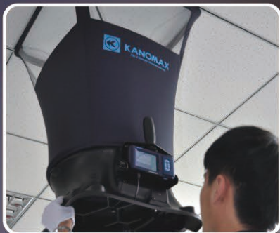
具备背压补偿功能及大气修正功能